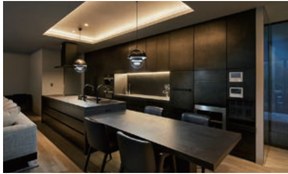
設計 株式会社 一級建築士事務所 アトリエマナ / 施工 株式会社キクシマ